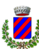
Comune di Monte San Giusto