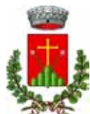
Comune di Montecosaro